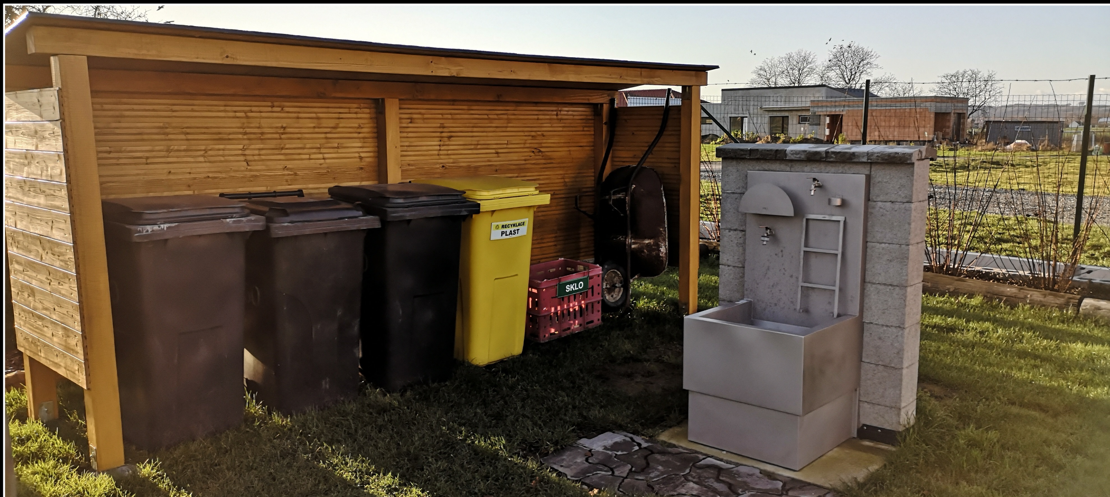
Příklad spojení servisní bod a odpady