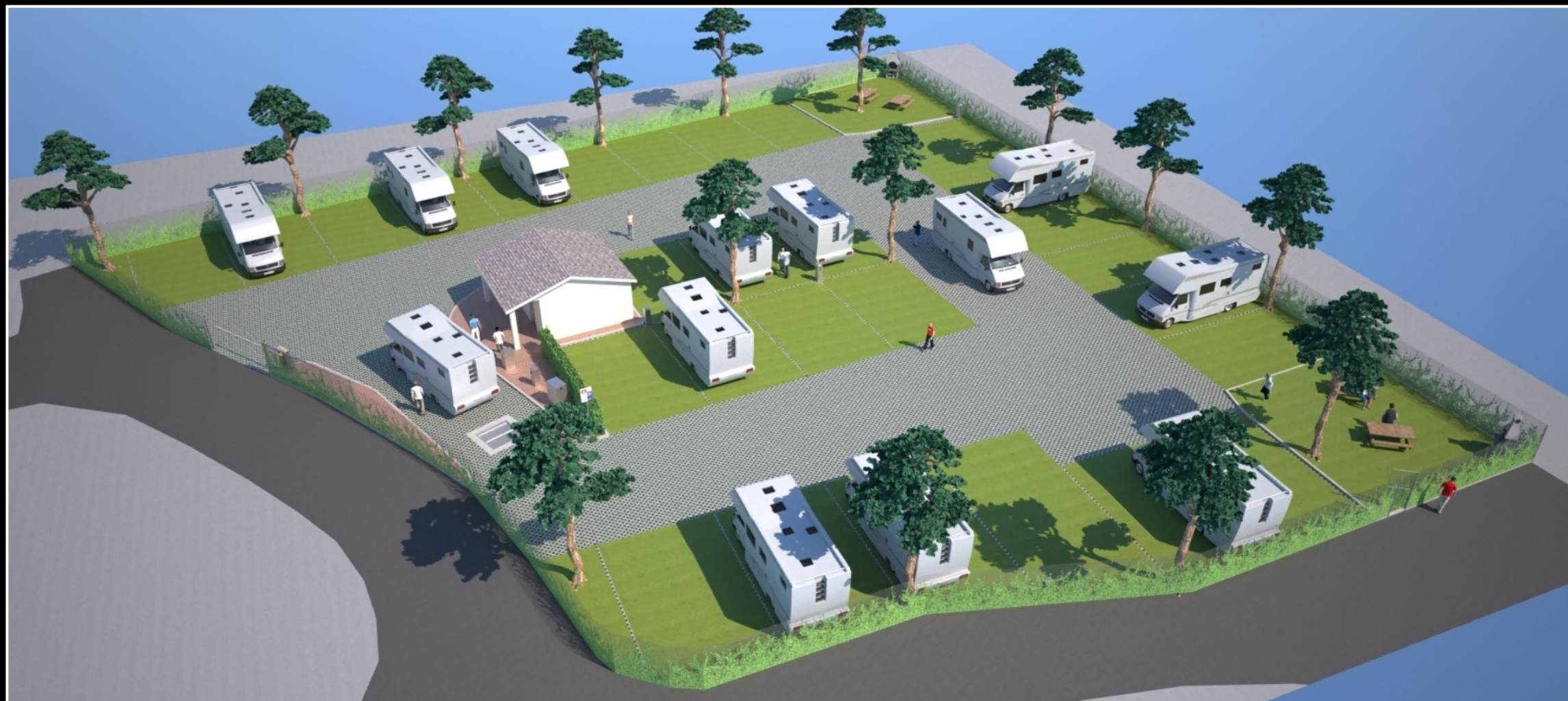
Vizualizace – plně vybavené stání