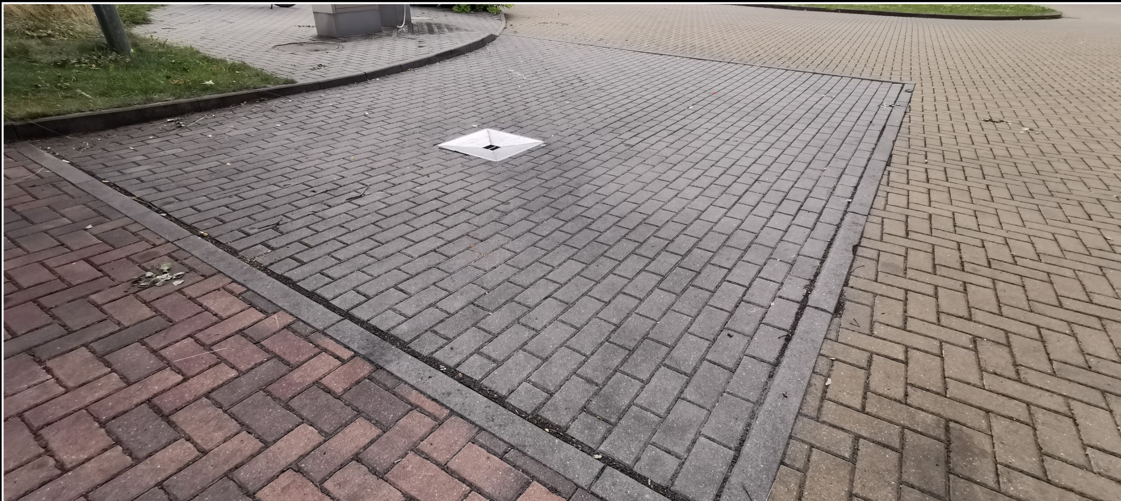
Zastávkové stání/turistické stání- Svitavy