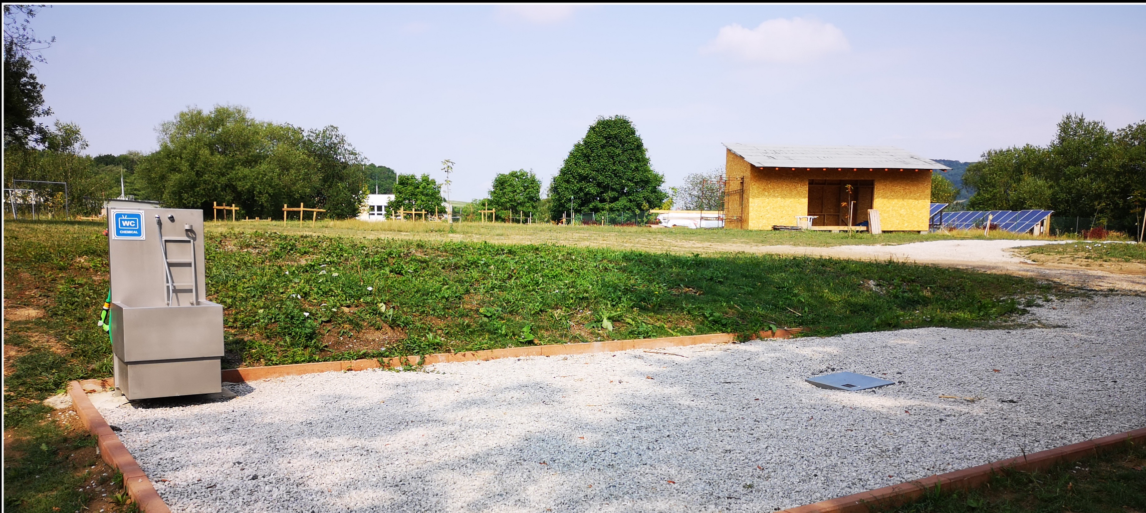
Servisní bod – komfortnější řešení- nerez