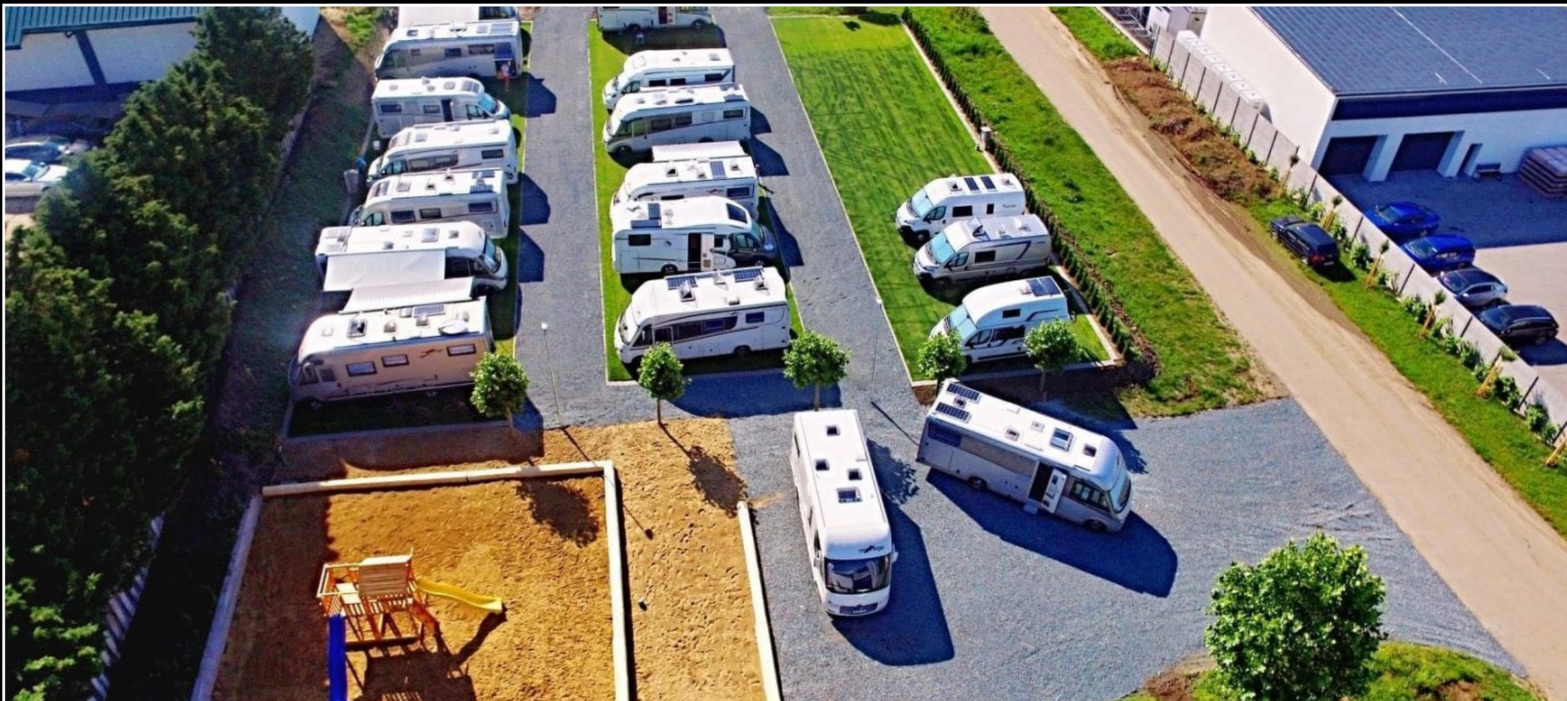
Camper park – Velké Bílovice