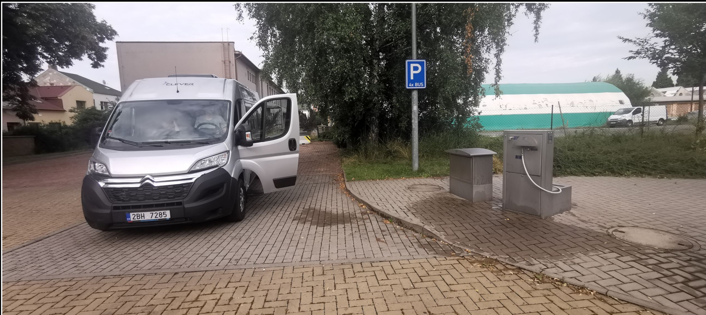
Zastávkové stání/turistické stání- Svitavy