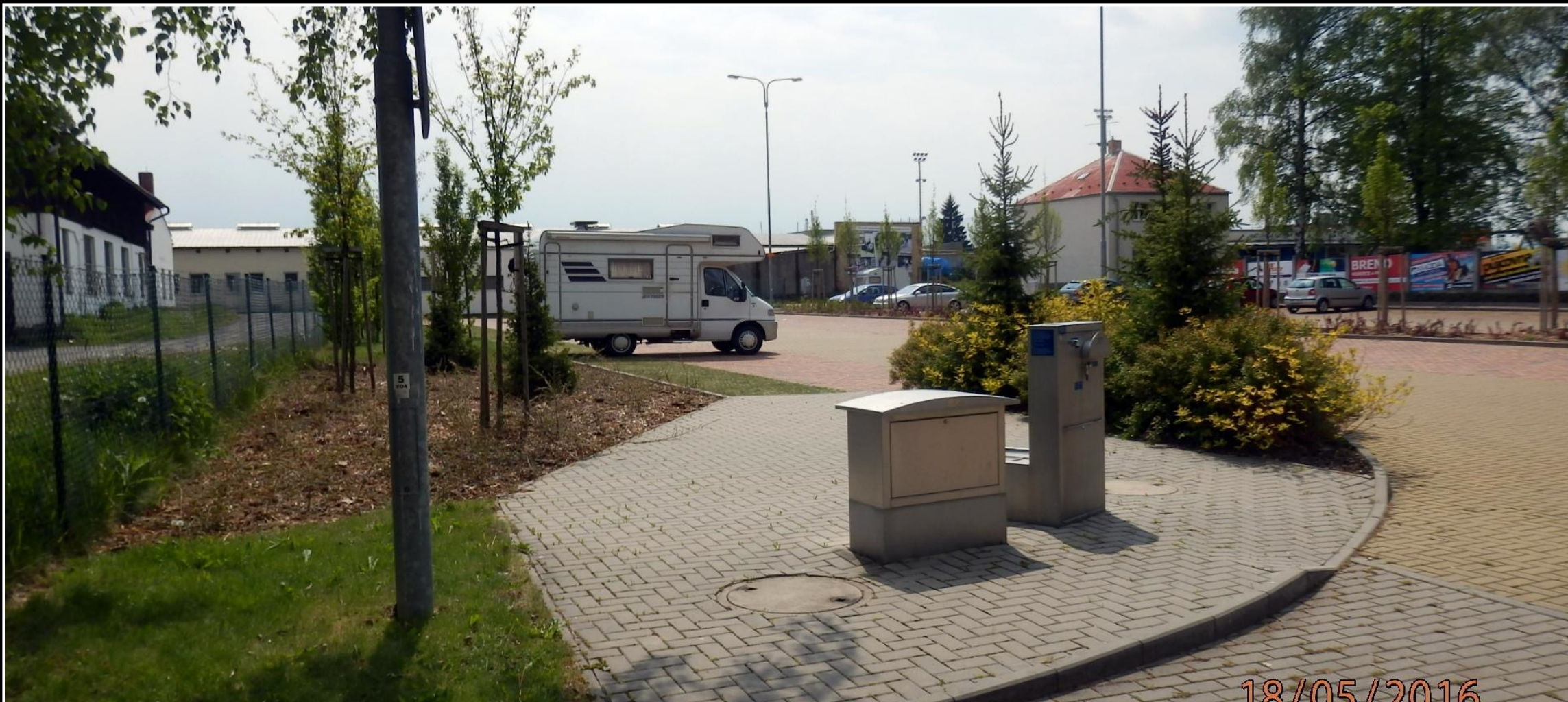
Zastávkové stání/turistické stání - Svitavy