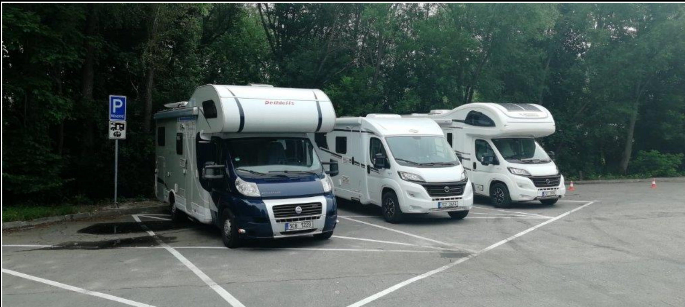
Klasické parkoviště - Prachatice