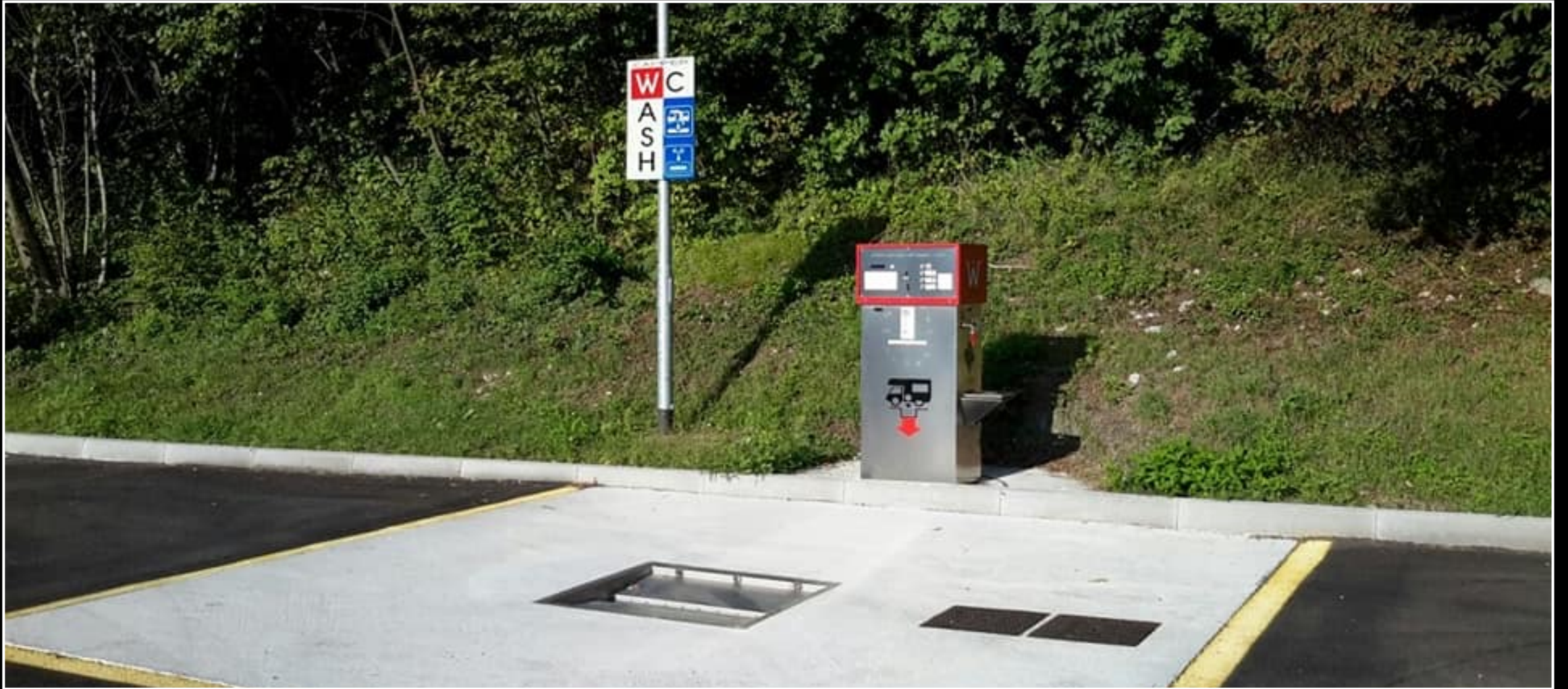
Servisní bod u dálnice – plně automatizované