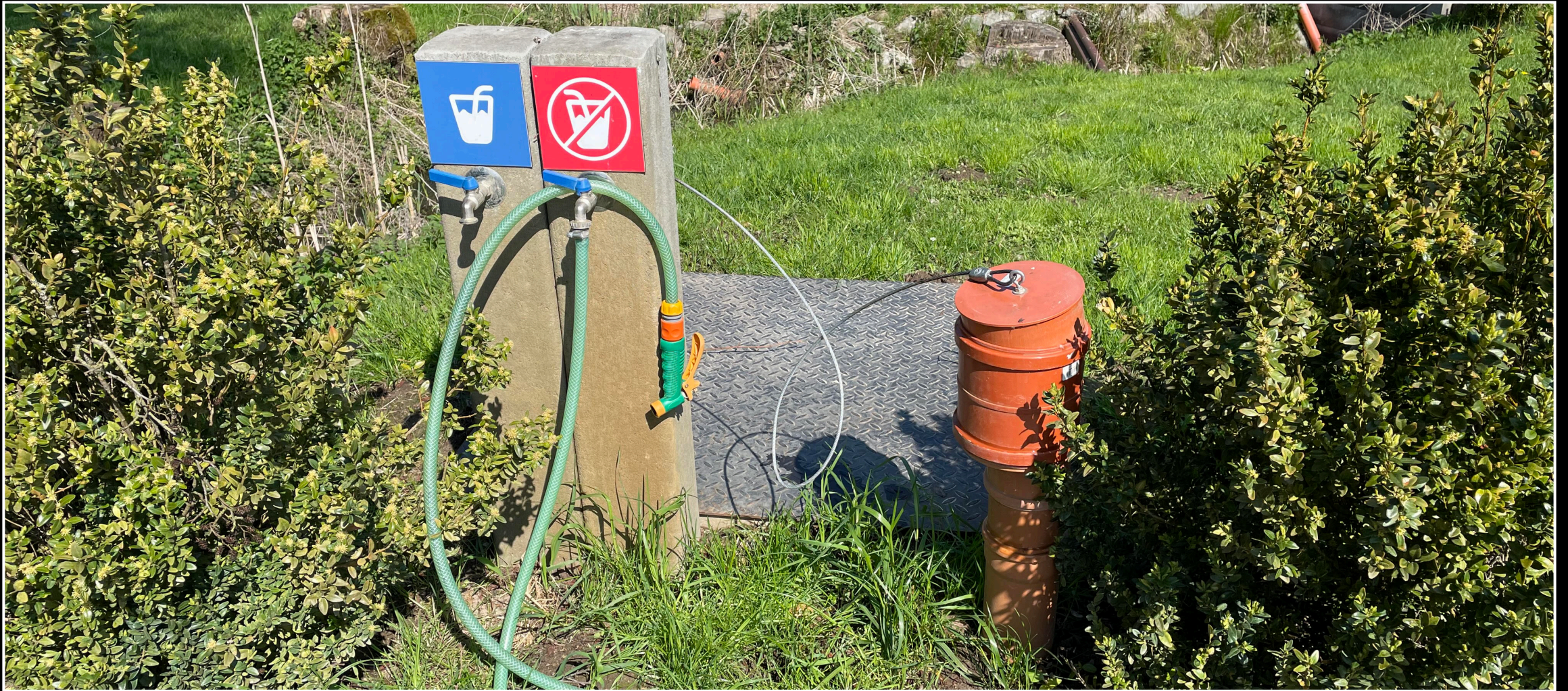
Servisní bod – jednoduché řešení