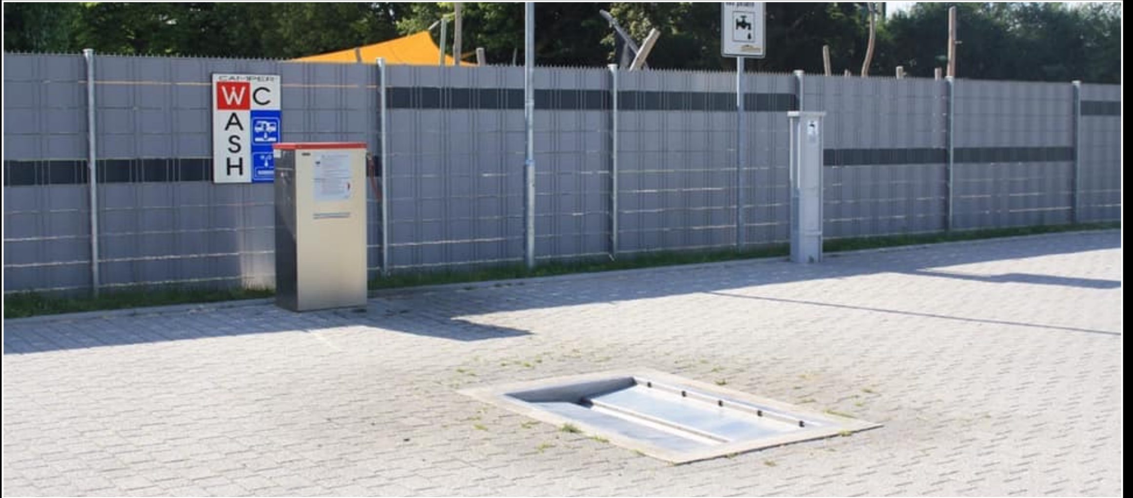
Servisní bod v obci u průmyslové zóny– plně automatizované