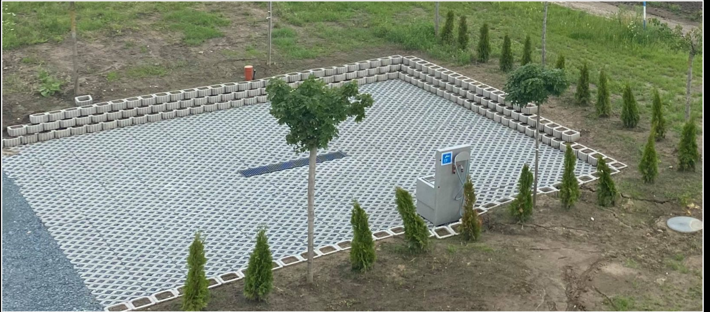
Camper park – Velké Bílovice – servisní bod