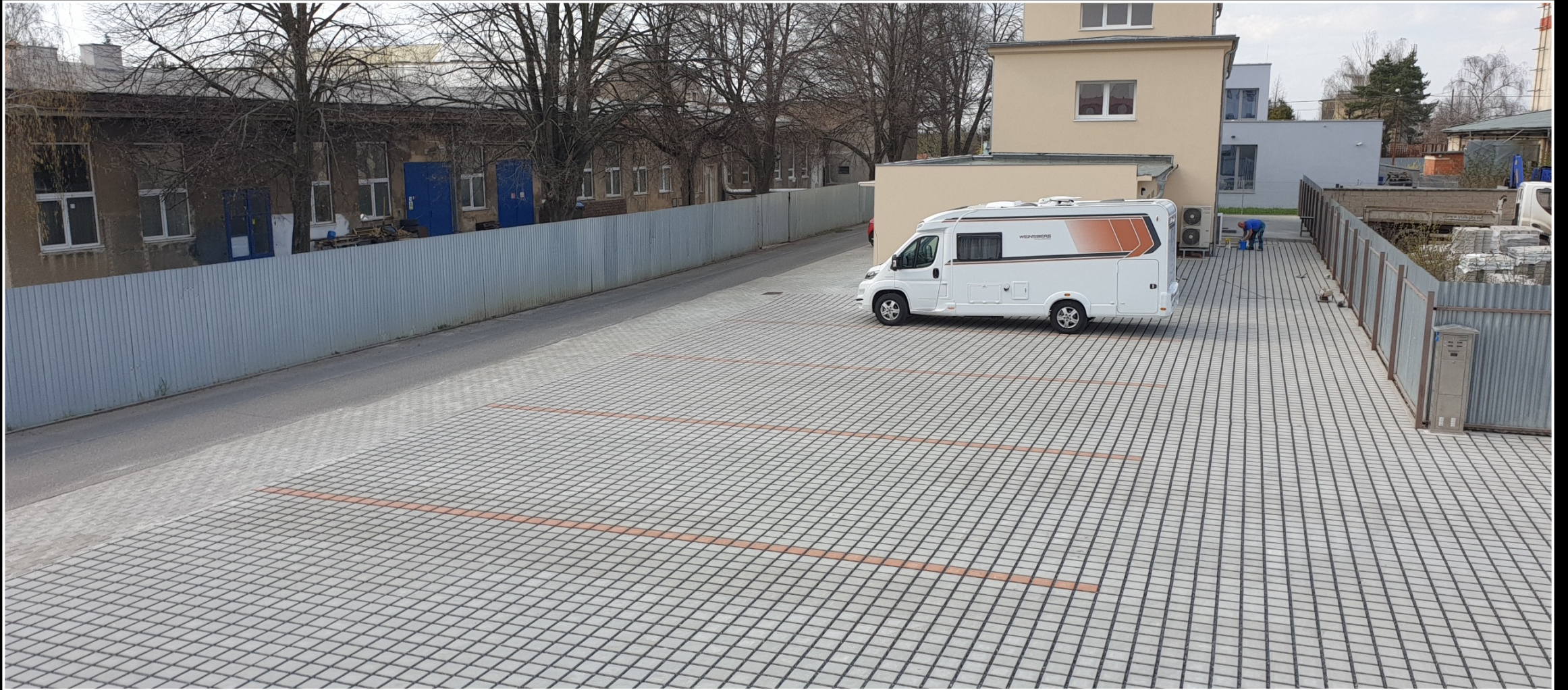
Parkoviště se servisním bodem – Praha Letňany