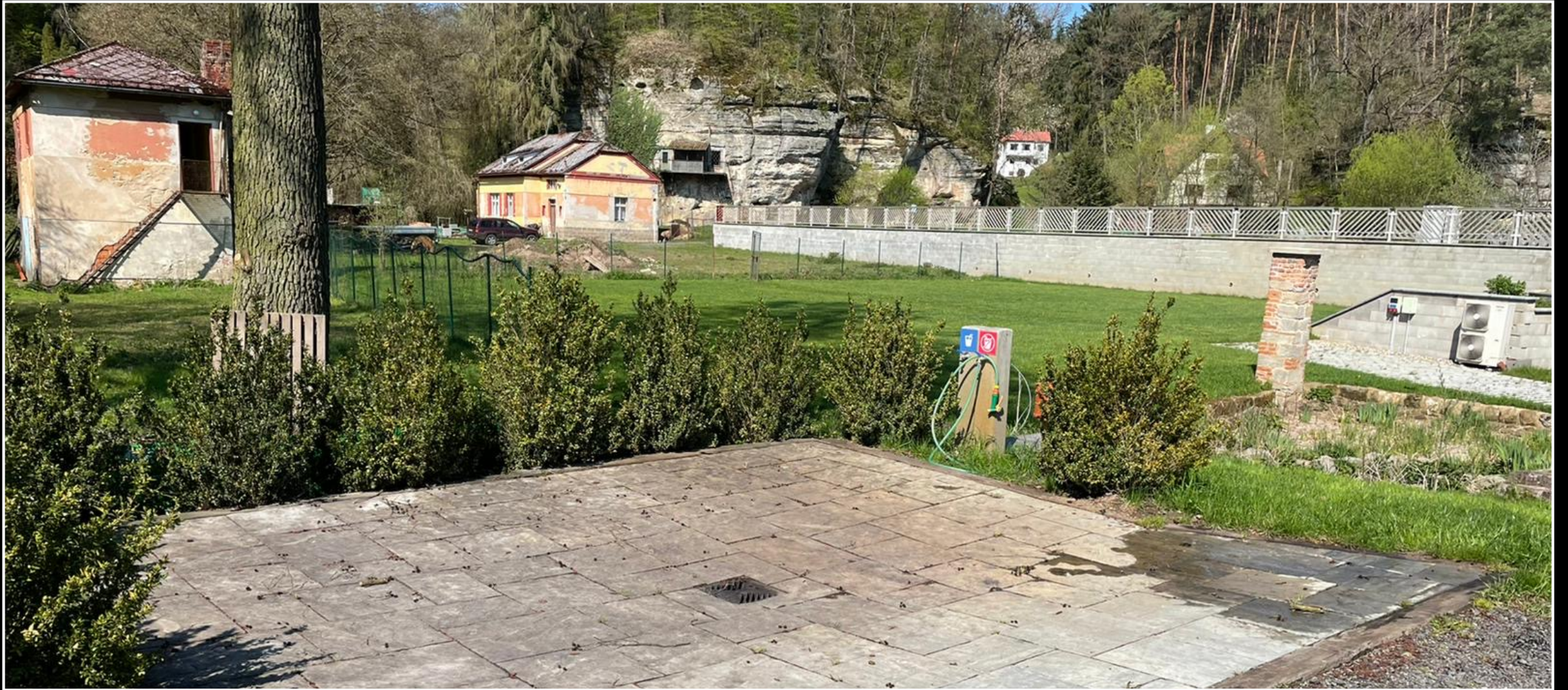
Servisní bod stání – jednoduché řešení